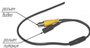
Схема внешних подключений